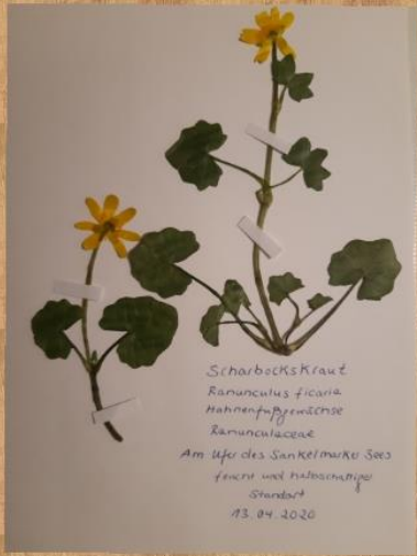
Scharbockskraut Ranunculus ficaria Hahnenfußgewächse Ranunculaceae Am Ufer des Sankelmarker Sees feucht und halbschattig Standort 13.04.2020